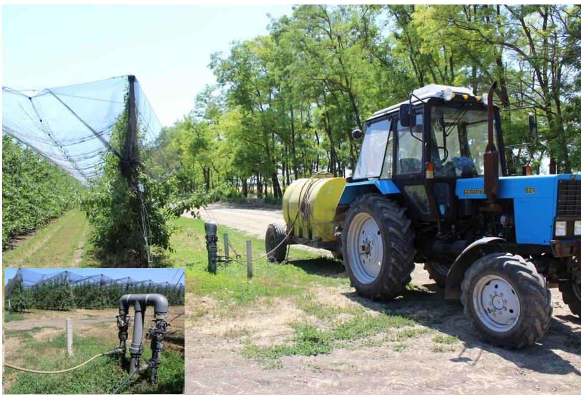
2- расм. Томчилатиб суғориш тизимида минерал ўғитларни қўллаш.