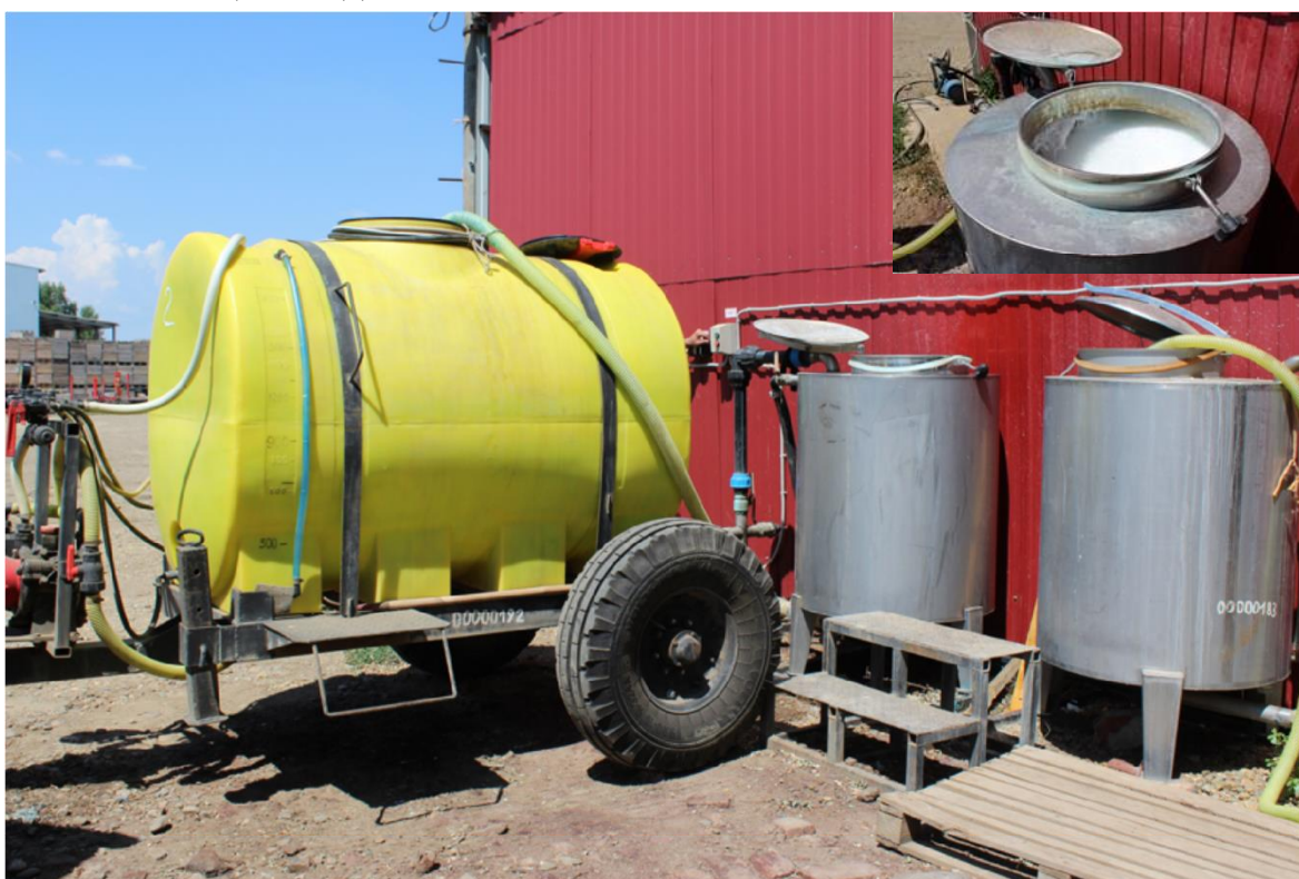
1- расм. Ўғит оналик эритмасини тайёрлаш

Шундай қилиб, интенсив мевали боғларни барпо қилишдан олдин ва томчилатиб суғориш тизимини қуриш учун албатта сув сифатини аниқлаб олиш талаб қилинади.